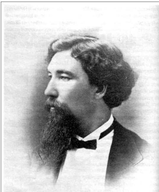
М.Д. Бутин. 1872 г.

По своему содержанию лекции эти возможно разделить на несколько разрядов: о религии вообще, о жизни, ее смысле и нравственных основах, о причинах нестроения в этом мире, о зле и т. д. В настоящее время эти вопросы особенно требуют всестороннего и правильно-православного освещения и разрешения. На такие темы были следующие лекции: 3 марта протоиереем Верномудровым „Религия, как исторический факт и как фактор культурного развития человечества“, 22 октября М.В. Одиновым „Нравственные основы жизни по учению