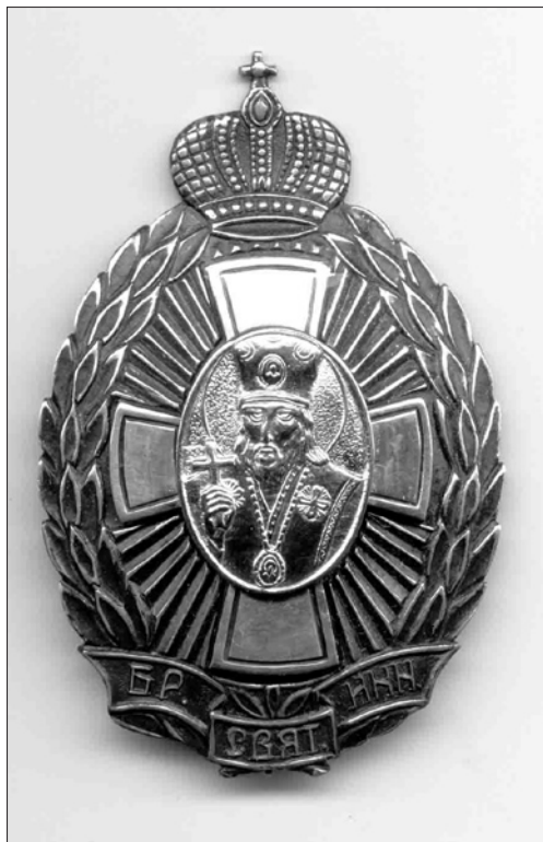
Современный нагрудный знак Братства святителя Иннокентия. Фото В. Белова, 2005 г.

акафиста. По окончании Богослужения все переходят в Родионовскую школу, где происходят заседания Благотворительного отдела Братства св. Иннокентия» (1, л. 177 об.). В 1920 году, с момента прихода большевиков и установления в Иркутске советской власти, союзы, братства и другие общественные организации прекратили существование.