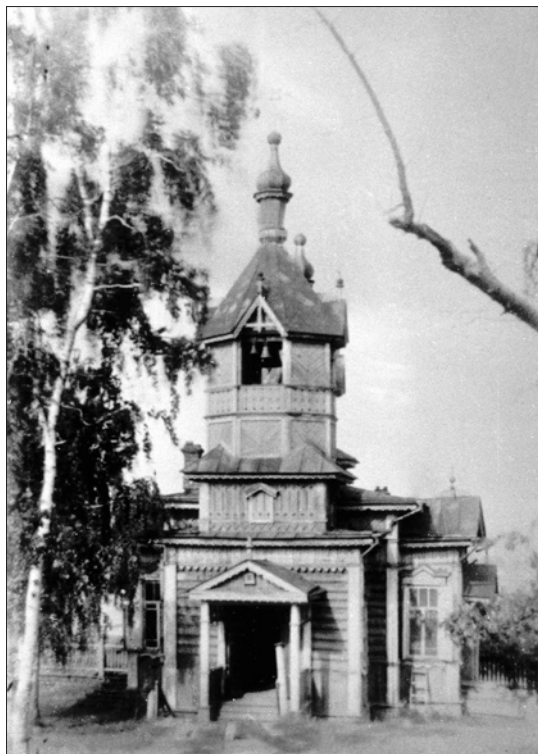
Церковь во имя Св. Иннокентия Иркутского в Иркутске

ся сектанты», «Что сделал для России св. князь Владимир» и др.). Труды, изданные братством на протяжении двух десятилетий, являются важным источником для историков, краеведов в изучении духовной, научной и культурной жизни Восточной Сибири.