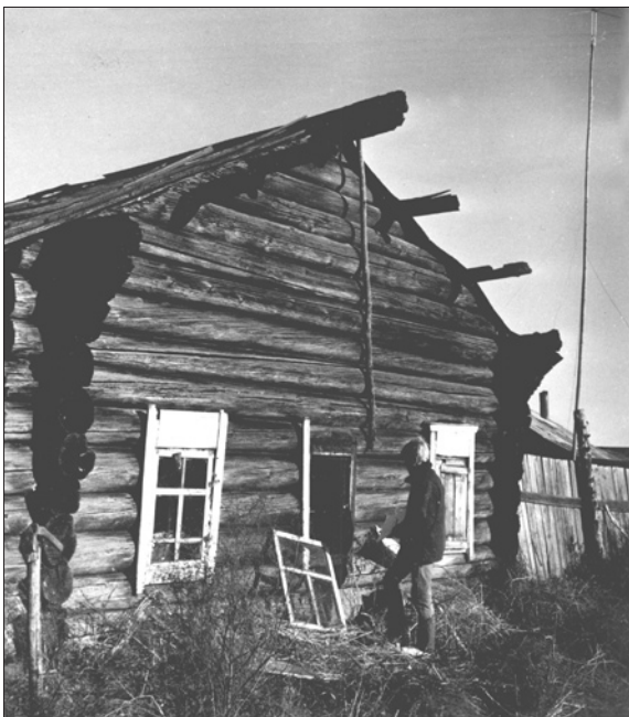
Дом-одноколок в деревне Ёдарма Усть-Илимского района Иркутской области. Фото из архива АЭМ «Тальцы», 1987 г.

В плане он представляет собой практически ровный квадрат размерами 5,8 x 5,7 м, с поздним приделом с одной со стороны главного входа у восточного фасада. Срублен